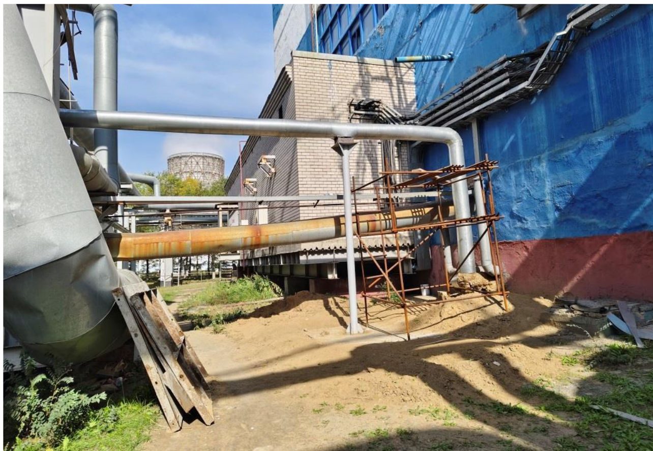
Фото 5 – Покрытие тепловой изоляции трубопровода оболочкой из оцинкованного листа.