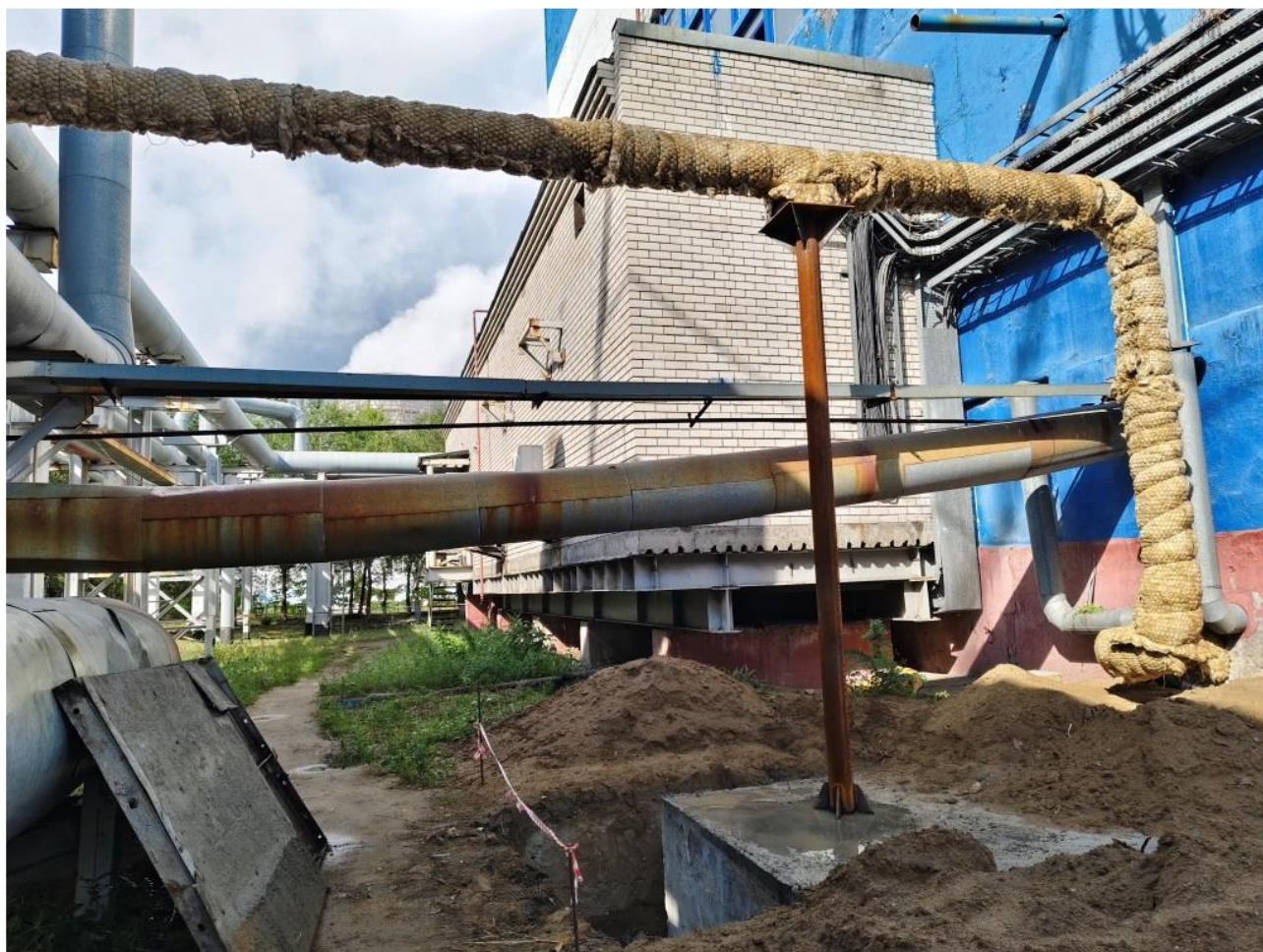
Фото 4 – Монтаж наружного трубопровода с устройством тепловой изоляции на металлическую опору.