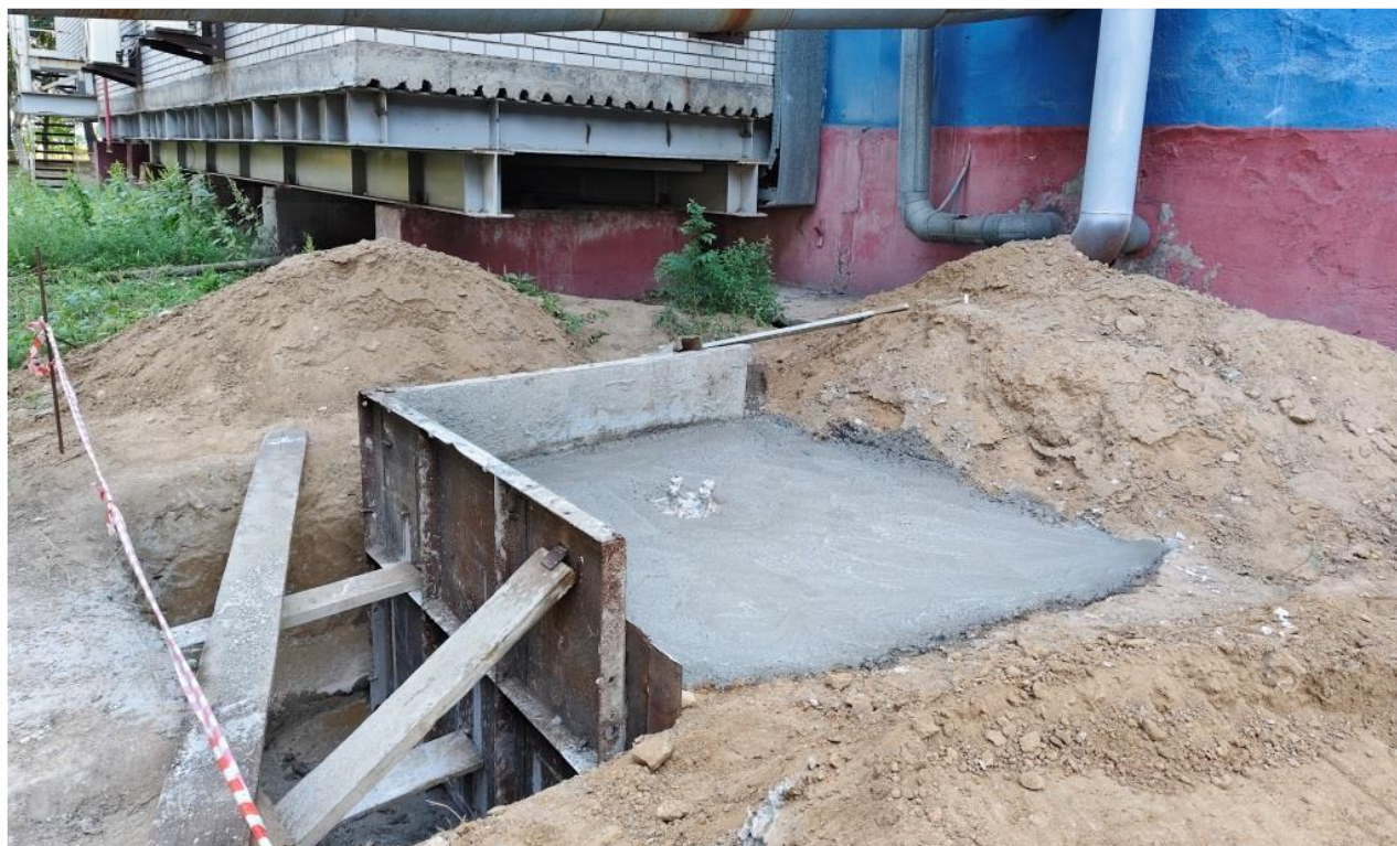
Фото 3 – Устройство фундамента под опору наружного трубопровода