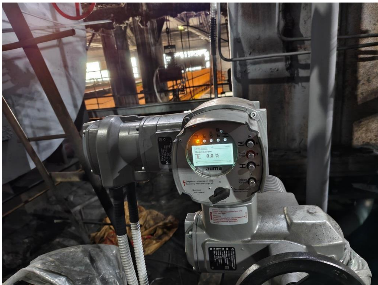
Фото 10 – Наладка оборудования на отметке +21,6 м.