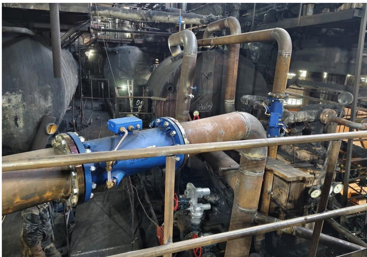
Фото 9 – Монтаж и обвязка оборудования тепловой сети на отметке +21,6м.