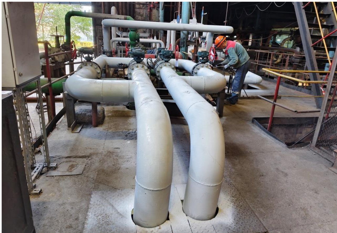
Фото 6 – Участок выполненной тепловой сети на отметке +1,6 метра.