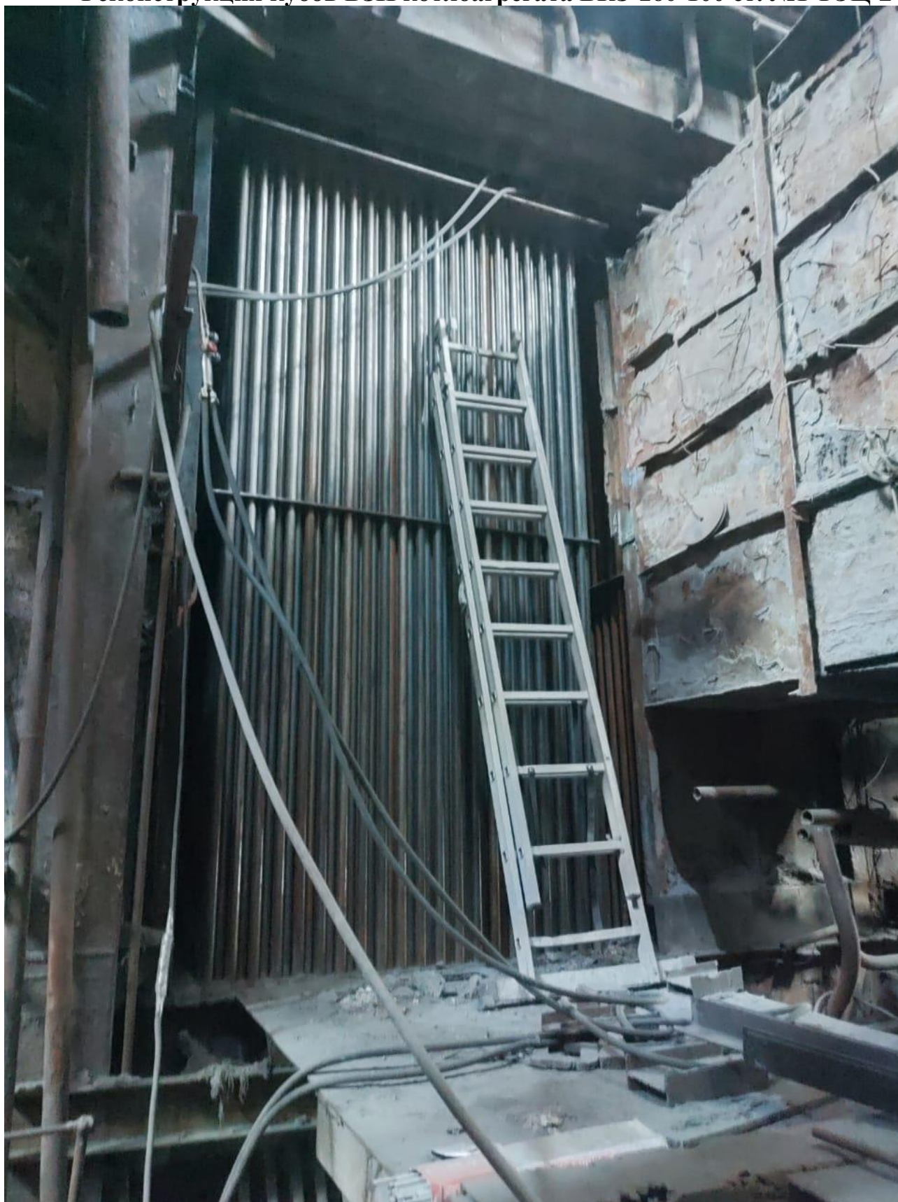
Фото 1 – Монтаж новых кубов ВЗП