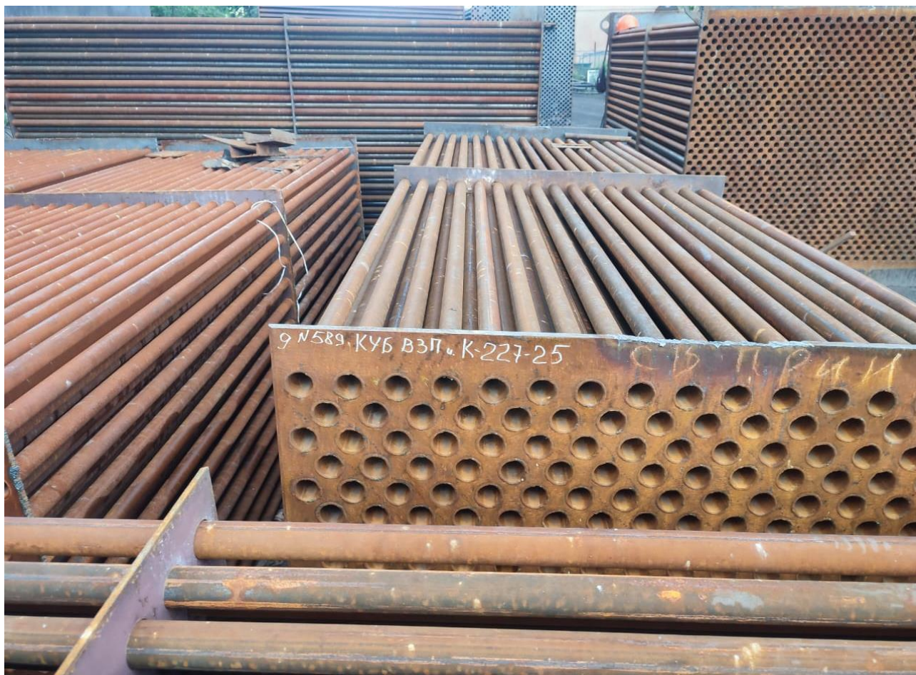
Фото 2 – новые кубы ВЗП