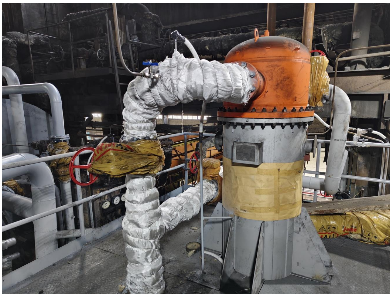
Фото 11 – Теплообменник на отметке +21,6 м.